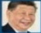
XI JINPING (CHINE)