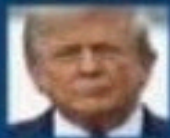
DONALD TRUMP (ÉTATS-UNIS)