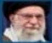
ALI KHAMENEI (IRAN)