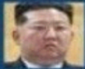
KIM JONG-UN (CORÉE DU NORD)